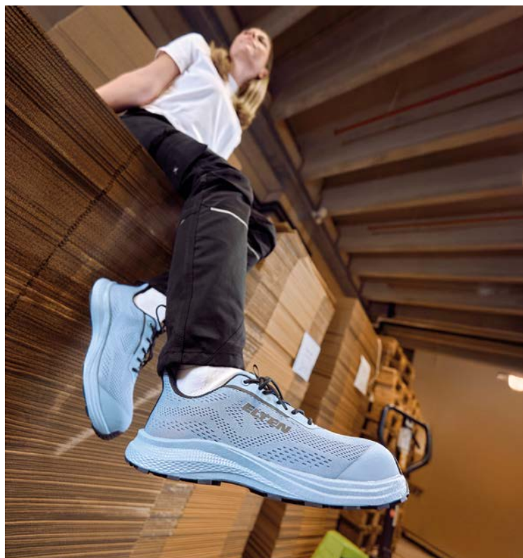
Den leichtesten Sicherheitsschuh von Elten gibt es in verschiedenen Varianten. Hier in einem leichten blau als ‚Tavixx XXFE blue Low ESD S1‘.