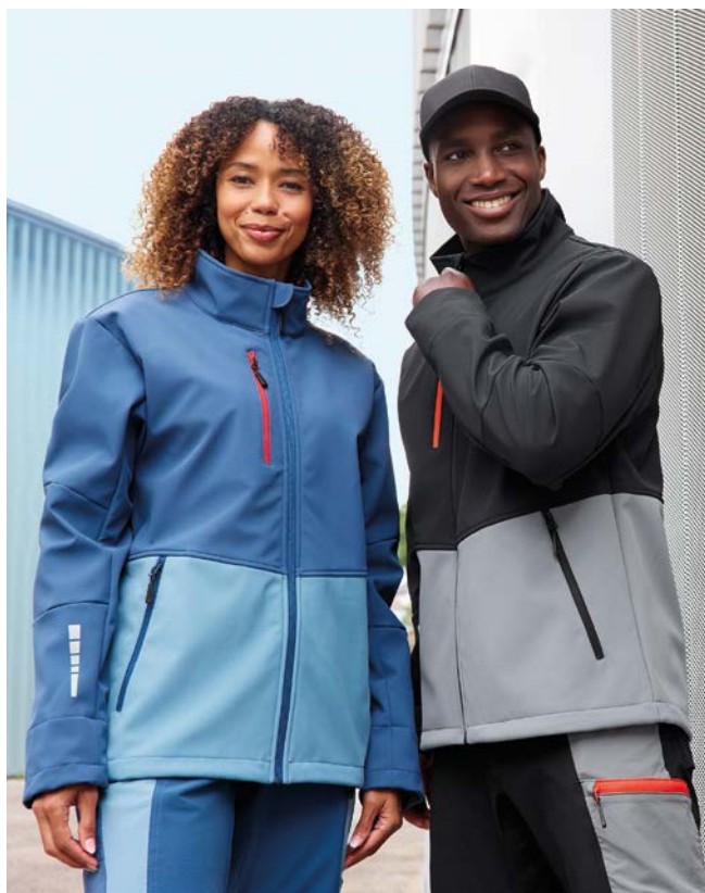
Die Workwear Softshell Jacket aus strapazierfähigem, elastischem Softshell-Material mit TPU-Membran und Fleece-Innenseite.

ge Stauraum, während elastische Bündchen, ein Kordelzug am Saum und ergonomisch geformte Ellenbogen für eine optimale Passform sorgen. Die Kapuze kann darüber hinaus mit einem Schutzhelm getragen werden.