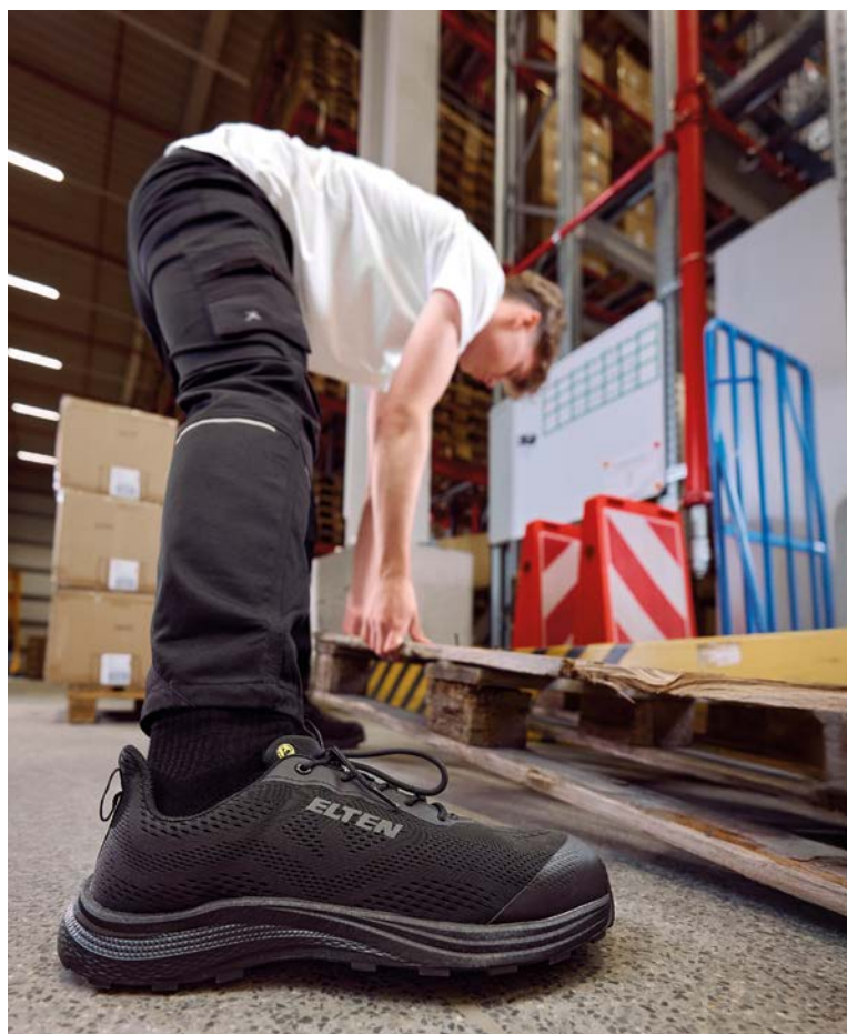
Für alle, die es lieber schlicht mögen, gib es den Tavixx black Low ESD S1PS komplett in Schwarz.