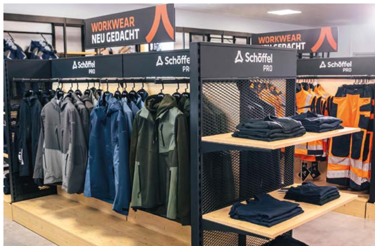
Von Büro bis Baustelle: die Schöffel PRO Kollektion bietet Lösungen für unterschiedlichste Arbeitsbereiche.

strategischer Vertrieb bei der Konrad Kleiner GmbH betont: „Die Bekanntheit der Marke Schöffel sorgt zusätzlich für Rückenwind im Vertrieb. Viele Kundinnen und Kunden verbinden den Namen seit Jahrzehnten mit Qualität und hochwertigen Materialien. Dieses Vertrauen überträgt sich auch auf den Bereich Workwear.“ Gleichzeitig schafft das Konzept Vorteile für alle Beteiligten: Unternehmen profitieren von der persönlichen Beratung, einer einfachen Auswahl und einem sicheren Bestellprozess. Der Fachhandel stärkt seine Rolle als kompetenter Partner vor Ort. Und Schöffel PRO kann seine Produkte genau dort präsentieren, wo die Nachfrage entsteht.