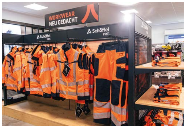
Im Herbst 2025 ist Schöffel PRO in das Segment der Warnschutzkleidung eingestiegen. Die neue Warnschutz-Kollektion besteht aus verschiedenen Lagen für Oberbekleidung und reicht von Basis- über Wetterschutz- bis hin zu Wärmeschichten.