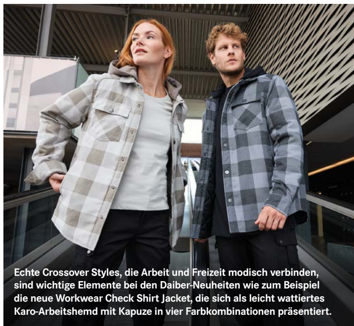
Echte Crossover Styles, die Arbeit und Freizeit modisch verbinden, sind wichtige Elemente bei den Daiber-Neuheiten wie zum Beispiel die neue Workwear Check Shirt Jacket, die sich als leicht wattiertes Karo-Arbeitshemd mit Kapuze in vier Farbkombinationen präsentiert.

Wie es der Claim „Einfach Daiber.“ impliziert, ist auch die Gestaltung der neuen Kampagne bewusst einfach gehalten. Die Kampagnenmotive zeigen jeweils ein Bestseller- oder Neuprodukt aus dem Hause Daiber – lediglich ergänzt um die jeweilige Produktnummer.