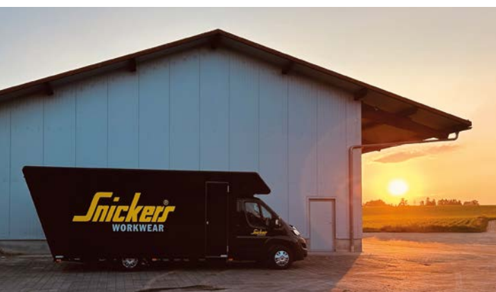
Der Showtruck von Snickers Workwear ist Beratungs- und Präsentationsraum – aber vor allem Erlebnisraum.

Ein großer Vorteil für die individuelle Anpassungsfähigkeit ist die außergewöhnliche Größenvielfalt bei Snickers Workwear. Unterschiedliche Körperformen und Anforderungen werden nicht als Herausforderung, sondern als Selbstverständlichkeit betrachtet. So bietet Snickers Workwear Oberbekleidung unter anderem in den Größen XS bis 6XL, sowie Kurz- und Langgrößen. Die Arbeitshosen werden in insgesamt 130 Größen, davon 42 Standardgrößen, ohne Aufpreis geliefert. Komplettiert wird die Vielfalt durch fünf verschiedene Hosenslängen und drei Passformen: Slim Fit, Regular Fit und Loose Fit. Damit sitzen nicht nur die Hose, sondern auch das Werkzeug und die Knie Schonner dort, wo sie gebraucht werden. Diese Auswahl ermöglicht es, für nahezu jede Person die passende Lösung zu finden. Das steigert nicht nur die Zufriedenheit der Mitarbeitenden, sondern auch deren Leistungsfähigkeit im Arbeitsalltag.