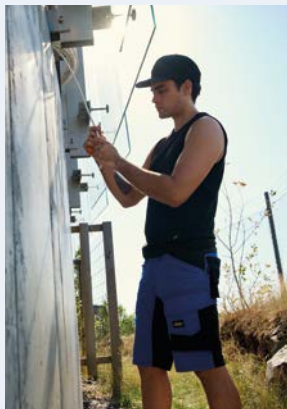
Snickers Workwear bietet im Rahmen der Stay-Fresh-Kollektion Kleidungsstücke mit einem UV-Schutz bis Lichtschutzfaktor 50.

Arbeitskleidung ist in den Bereichen Bau und Konstruktion von entscheidender Bedeutung – die Kollektionen LiteWork und Stay Fresh stellen diese Tatsache einmal mehr unter Beweis.