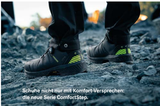
Schuhe nicht nur mit Komfort-Versprechen: die neue Serie ComfortStep.

Letztlich geht es um eine Partnerschaft auf Augenhöhe: Wenn unsere Handelspartner wachsen, wachsen wir mit ihnen.