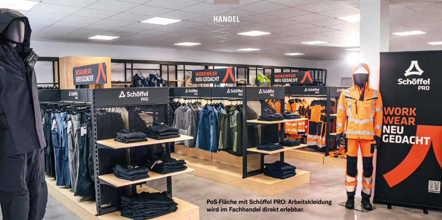
PoS-Fläche mit Schöffel PRO: Arbeitskleidung wird im Fachhandel direkt erlebbar.