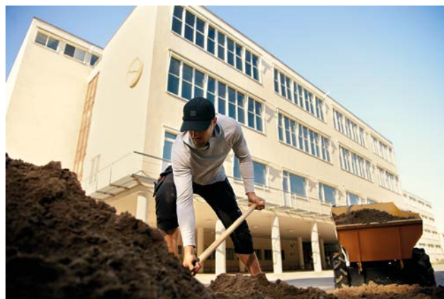
Die Stoffe und Materialien mit geringem Gewicht sorgen für Sonnenschutz und gleichzeitig für eine gute Durchlüftung.